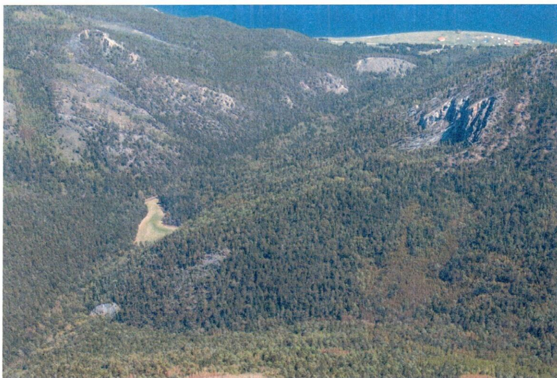
Рис. 1. Озеро Сухое в период отсутствия воды. На дальнем плане – озеро Байкал.