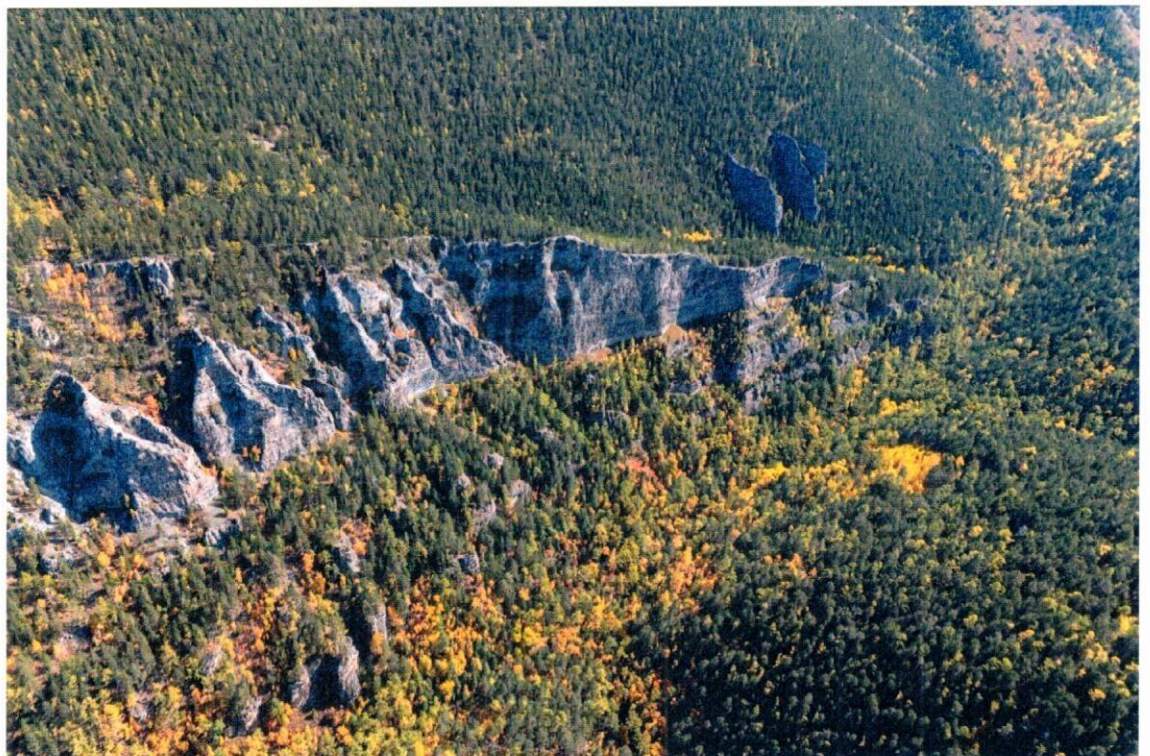
Рис. 4. Скальная гряда Архей.