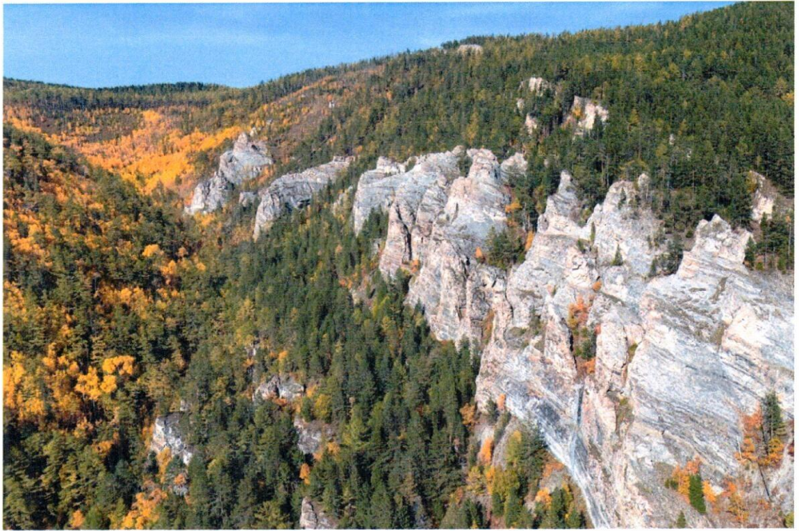
Рис. 3. Скальная гряда Архей.